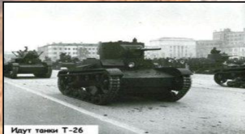
Идут танки Т-26

За ними следуют мотопехота, тягачи с артиллерией, бронемашины, танки. Потом идут зенитные и прожекторные полки.