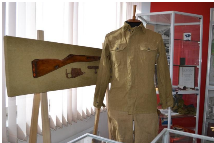
Макет винтовки Мосина