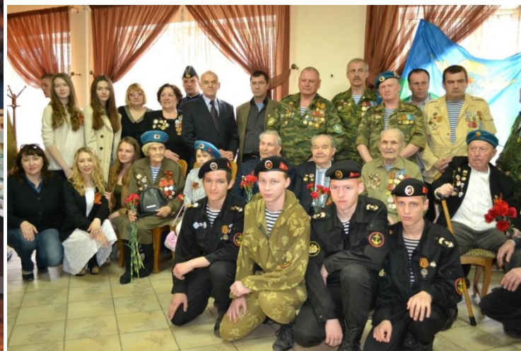
Встреча в музее Ижевского оружейного завода с Президентом Общероссийской общественной патриотической организации и военно- спортивного союза Михаилом Тимофеевичем Калашниковым с делегатами из 12 регионов Российской Федерации (в т.ч. И ГАПОУ СО «ТМК») 2011 г.