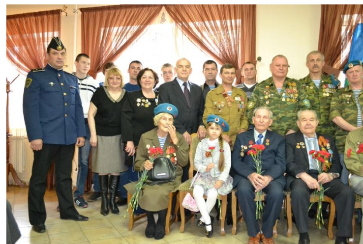
Встреча с ветеранами ВОВ