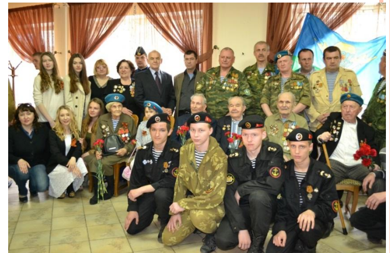
ВСТРЕЧА С ВЕТЕРАНАМИ ВОВ