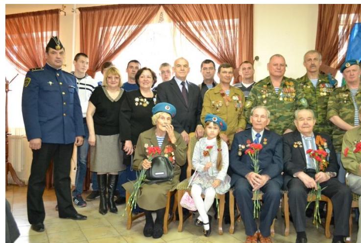
ВСТРЕЧА С ВЕТЕРАНАМИ ВОВ