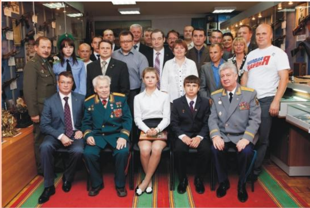
Встреча в музее Ижевского оружейного завода с Президентом Общероссийской общественной патриотической организации и военно-спортивного союза Михаилом Тимофеевичем Калашниковым с делегатами из 12 регионов Российской Федерации (в т.ч. И ГАПОУ СО «ТМК») 2011 г.